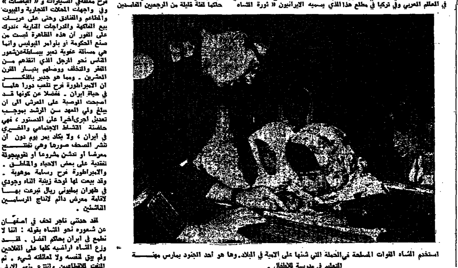
استخدم الشاه القوات المسلحة التي شنها على الامة في البلاد . وها هو أحد الجنود يمارس مهنة التعليم في مدرسة للاطفال .

لما كان من المحزن تحقيق المحزوات التي تم تحقيقها . والبرزناج الإصلاحية حكما لغة قلبية من المرجعين القاصدين